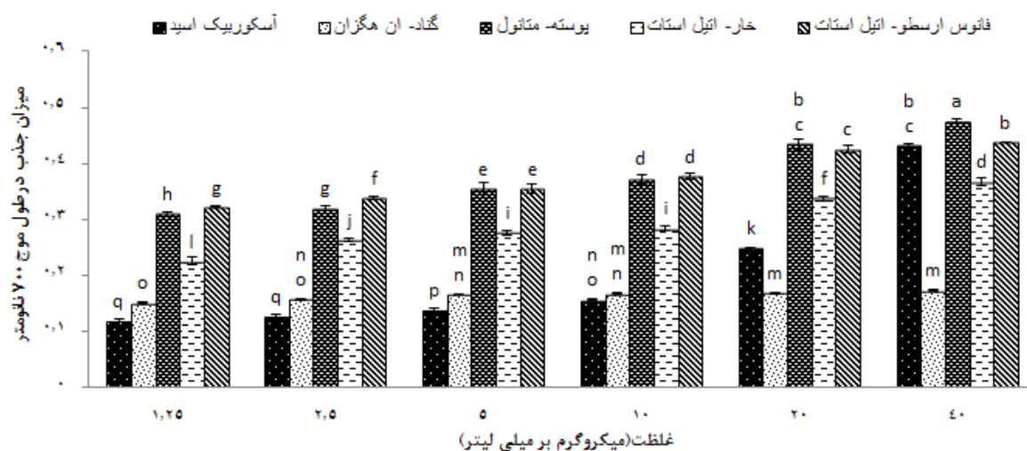
شکل 1 قدرت احیایی قوی‌ترین عصاره‌های توتیای دریایی در مقایسه با آسکوربیک‌اسید به‌عنوان استاندارد در غلظت‌های مختلف (میکروگرم بر میلی‌لیتر). حروف غیرمشابه بیانگر اختلاف معنی‌دار در سطح احتمال P \leq 0/05 است

از مقایسه بررسی‌های آماری بین قوی‌ترین عصاره‌های توتیای دریایی، مشاهده شد که پوسته متانولی (غلظت 40 میکروگرم بر میلی‌لیتر)، فعالیت احیاکنندگی بیشتری نسبت به آسکوربیک‌اسید به‌عنوان استاندارد دارد. در حالی‌که، کمترین میزان قدرت احیاکنندگی در آسکوربیک‌اسید (غلظت 1/25 و 2/5 میکروگرم بر میلی‌لیتر) مشاهده گردید. همان‌گونه که از نمودار برمی‌آید، میزان قابل‌توجهی قدرت احیاکنندگی نیز در غلظت 40 میکروگرم بر میلی‌لیتر فانوس‌ارسطو اتیل‌استاتی و آسکوربیک‌اسید و غلظت 20 میکروگرم بر میلی‌لیتر پوسته متانولی مشاهده شد که براساس شاخص‌های آماری نیز تفاوت معنی‌داری بین این غلظت‌ها وجود ندارد. براساس نتایج این مطالعه، اختلاف معنی‌داری بین عصاره‌های موجود در شکل 1 و غلظت‌های مختلف مورد آزمایش مشاهده گردید ( P \leq 0/05 ).