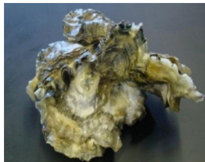
شکل ۱ نمای مورفولوژیک دوکفه‌ای Crassostrea gigas

نمونه‌های آب دریا و دوکفه‌ای Crassostrea gigas در اسکله بهمن قشم جمع آوری قرار گرفتند (شکل ۱). نمونه آب دریا از عمق ۱۵ cm و دوکفه‌ای نیز از مناطق ساحلی که احتمال حضور نفت وجود داشت از عمق ۱۰ الی ۱۵ متری به وسیله غواصی در ظروف استریل جمع‌آوری و روی یخ به آزمایشگاه منتقل شد. نمونه‌ها در دمای 4^{\circ}\text{C} تا انجام آنالیزهای بعدی قرار داده شدند. برای تعیین میزان تراکم و تنوع باکتری، از سطوح درونی دوکفه‌ای‌ها در آزمایشگاه نمونه‌برداری صورت گرفت [۷].