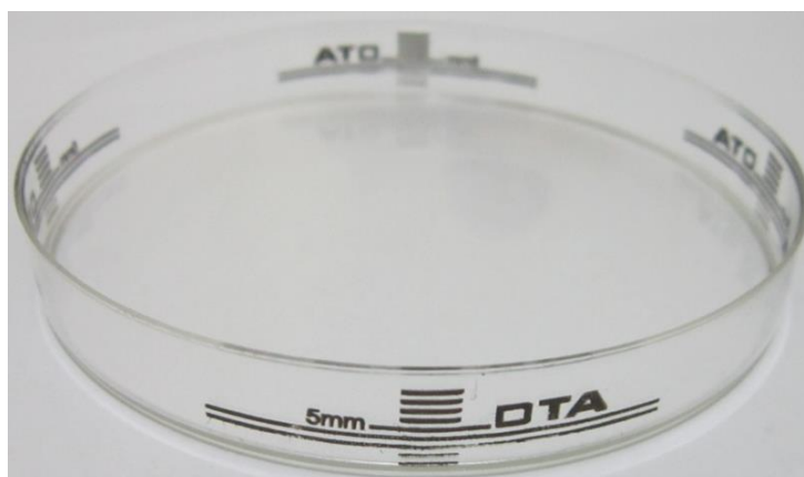
شکل ۱ دو خط بلند جهت تعیین ضخامت استاندارد محیط کشت طبق CLSI

برای این کار ابتدا از هر کدام از پتریدیش‌های شاهد ۲۰